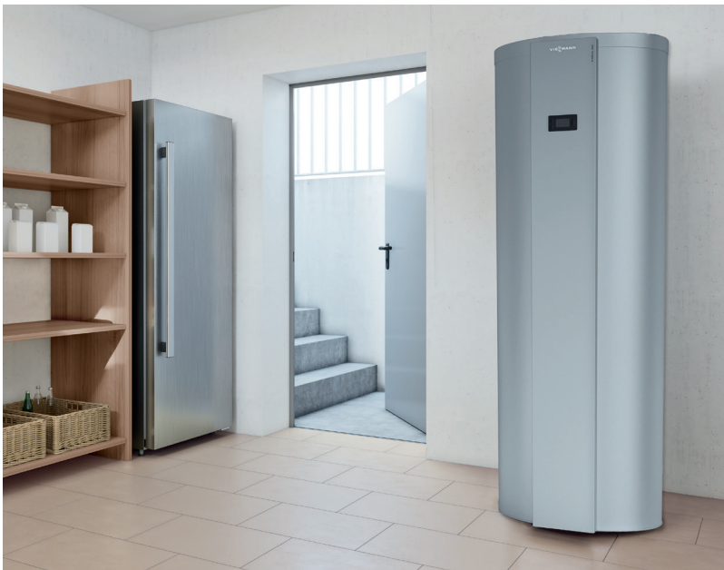
Bomba de calor de agua caliente Vitocal 262-A (modelo T2H)

La versión eléctrica (modelo T2E) viene equipada de fábrica con resistencia eléctrica seca de apoyo. La versión híbrida con intercambiador de calor (modelo T2H) también puede ser reequipado con resistencia eléctrica de apoyo. La conexión seca protege contra la calcificación y no es necesario vaciar el tanque de almacenamiento cuando deba reemplazarse la resistencia eléctrica de apoyo.